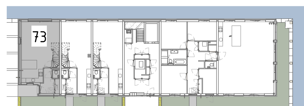
PLATTEGROND BEGANE GROND